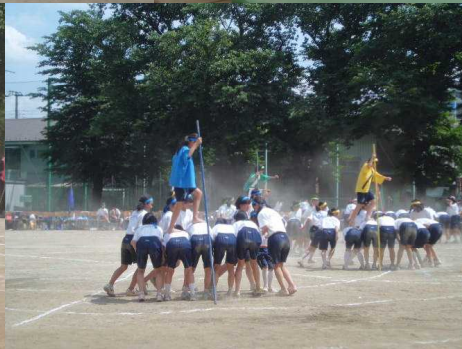
3年学年種目(大百足競争)