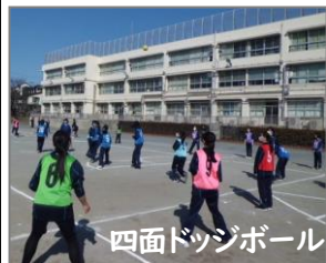
四面ドッジボール

卒業前、「学習発表会」という名のギターの弾き語り、歌、漫才...とても楽しい時間になりました。