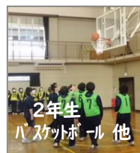
2年生 バスケットボール 他