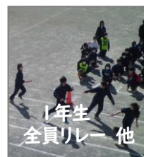
1年生 全員リレー 他