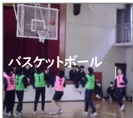
バスケットボール