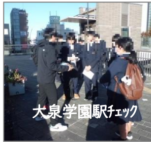
大泉学園駅チェック

1年生での「川越校外学習」、2年生での「都内校外学習」を3学期の「スキー移動教室」3年生での「修学旅行」へとつなげていきます。