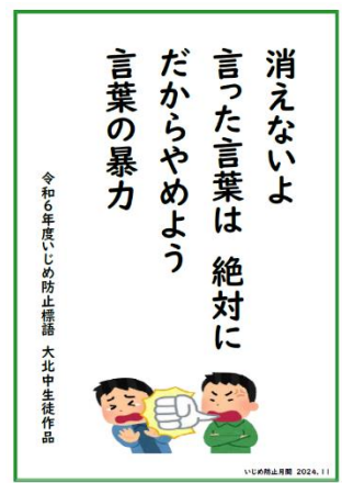
令和6年度 いじめ防止標語 大泉北中