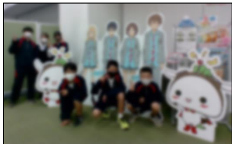
1年生 ねりま観光案内所

2学年とも、学校内での学びを学校外でしか経験できない学びへと広げ、好奇心に満ちた校外学習になりました。コロナ感染症対策やご準備など、ご協力ありがとうございました。