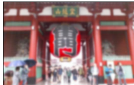
2年生 浅草 雷門