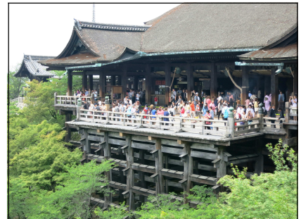
清水寺（清水の舞台）