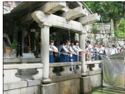
清水寺の音羽の滝