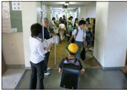
掲示版をもって誘導する教員