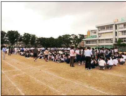
校庭に避難したときの様子