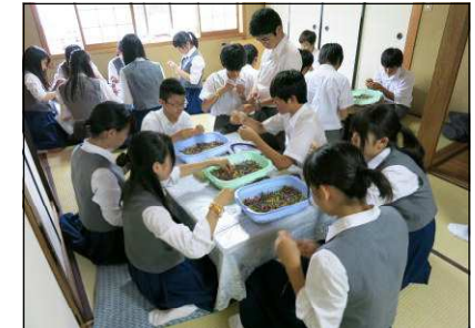
体験学習（念珠作りの様子）