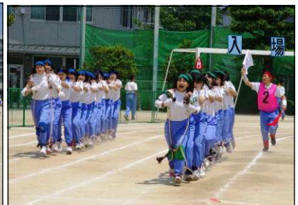
伝統の「むかで」(全学年)