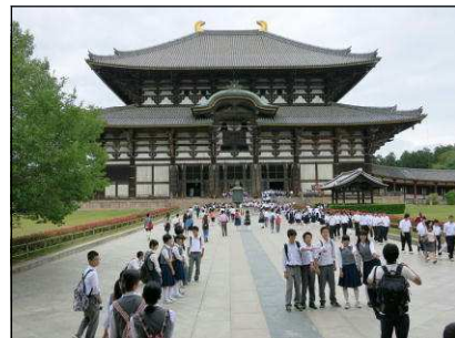
奈良東大寺の大仏殿