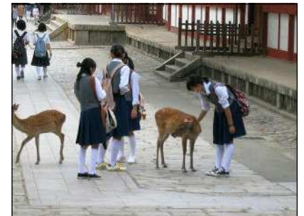
奈良公園の鹿と遊ぶ