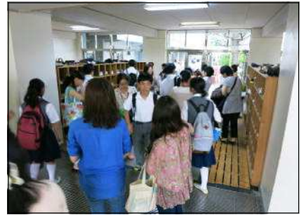
保護者と一緒に行く様子

平成25年6月18日（火）練馬区内の保育園、幼稚園、小学校、中学校を対象に、一斉防災訓練が実施されました。