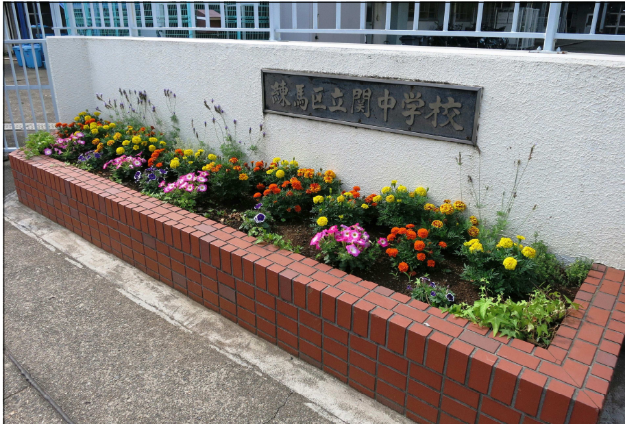
正門の花壇 (PTAグリーンボランティアが植えてくれました)

一ヶ月後は、すでに夏休みという時期となりました。この一ヶ月間で、運動会、3年修学旅行という大きな行事もあり、充実の中にも様々な体験的な学習が行われました。