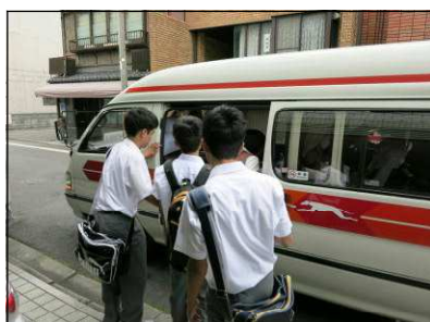
タクシー京都市内班行動