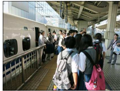
新幹線で京都へ（東京駅）