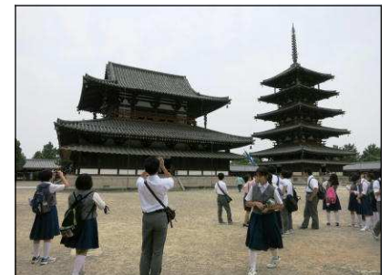
法隆寺（夢殿も見ました）