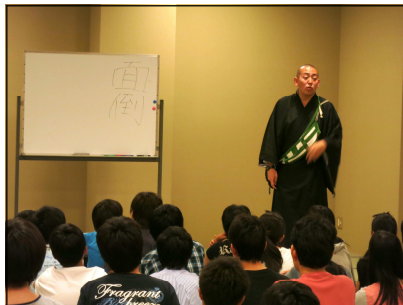
薬師寺のお坊さんの講話 （面倒と面白い）