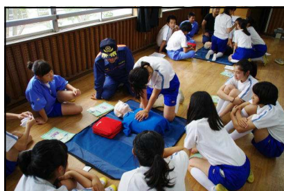
心肺蘇生訓練（AED含む）