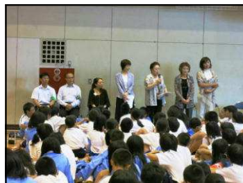
保護司の方からの話