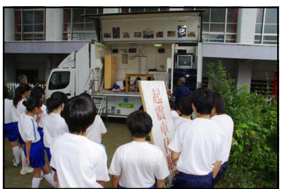
起震車体験（震度7を経験）