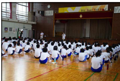
鳥羽避難拠点運営連絡会会長挨拶

訓練内容 ①普通救命演習3時間（40名：講習料は、関町北4・5丁目町会が出してくれました） ②炊飯訓練（700食作成）バーナー取扱訓練 ③発電機訓練 ④通信訓練 ⑤濾過機 ⑥仮設トイレ訓練 ⑦起震車体験 ⑧備蓄庫見学 ⑨消火器訓練