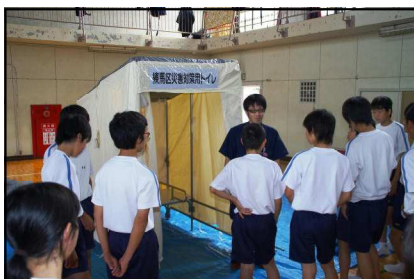
仮設トイレ組立訓練