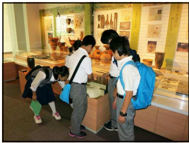
石神井公園ふるさと文化館