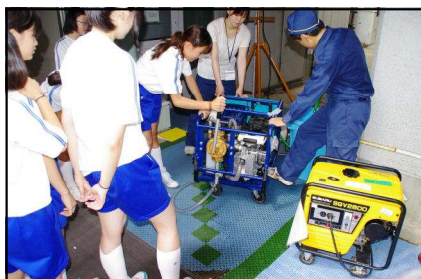
濾過機訓練（写真右は、発電機）