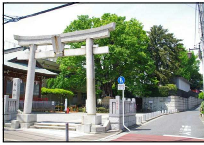
白山神社の大ケヤキ（天然記念物）

関中学校では、1年で「練馬を知る」、2年で「東京を知る」、3年で「日本を知る」という流れで学習を進めています。今回、1年校外学習として「練馬区内めぐり」を6月28日に行いました。