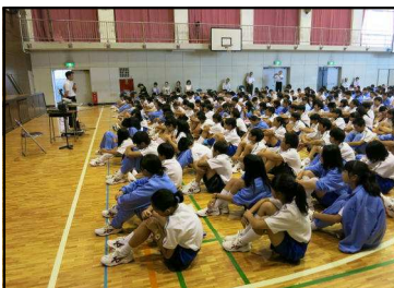
石神井警察からの話