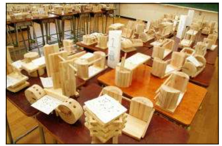
技術科の木材加工作品