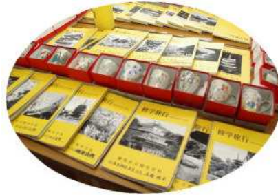
修学旅行レポートと清水焼絵付け