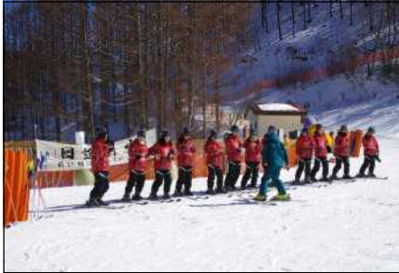
ブルークボーゲンについて学び、練習!