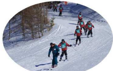
林間コースをトレインで滑る