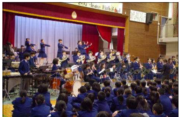
ウインドアンサンブル部の演奏