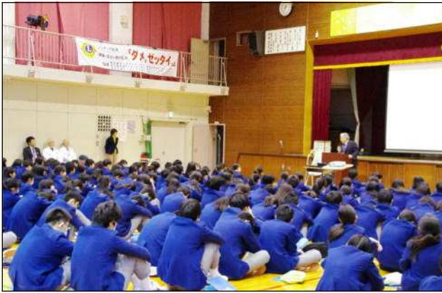
薬物乱用防止教室（関中体育館）