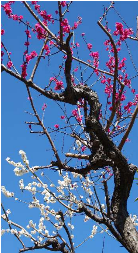
関中学校にある紅白の梅

平成28年度もあと僅かです。3月17日は、第42回卒業証書授与式が挙行されます。修了式は、3月24日です。まさしく、有終の美を飾る時となりました。