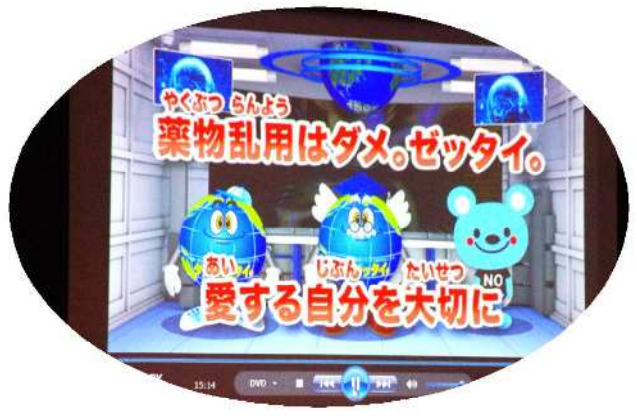
視聴したDVDの一部の映像