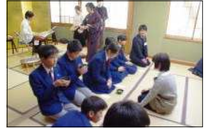
和室で行われたお茶と琴演奏