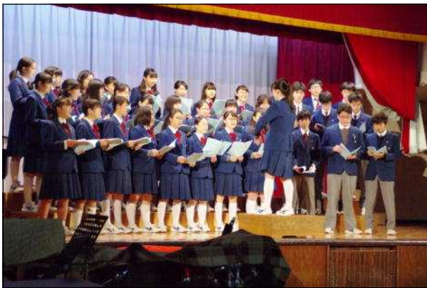
3年有志による合唱