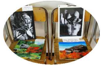
美術科の仏像スクラッチ、色紙