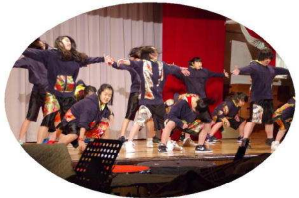
ダンス部のパフォーマンス