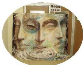
美術科の長尾先生の作品