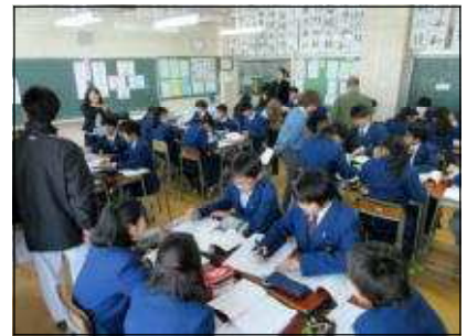
教材「いつも一緒に」を音読CDで聞き、場面絵を使用して登場人物の整理を行う。グループワーク（5～6人）で話し合い、ホワイトボードに書き入れる。