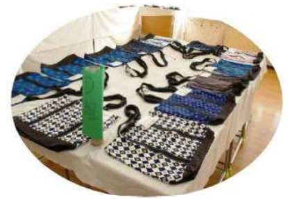
家庭科のトートバック