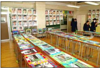
作品を鑑賞する生徒たち（自画像、木彫額、トートバックなど）