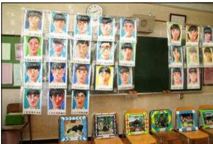
美術科の自画像と木彫額