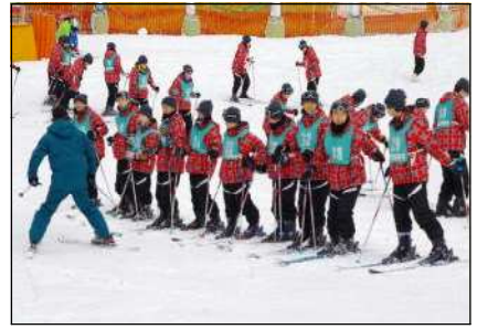
レベルごとの班に分かれて実習