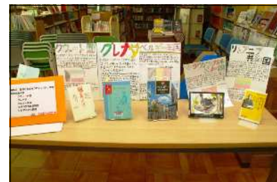
図書ボランティア部（関中がオリパラ教育で担当する国）

ベルギー 王国・グレ ナダ・ケ ート国・リ トアニア共 和国・マダ ガスカル共 和国