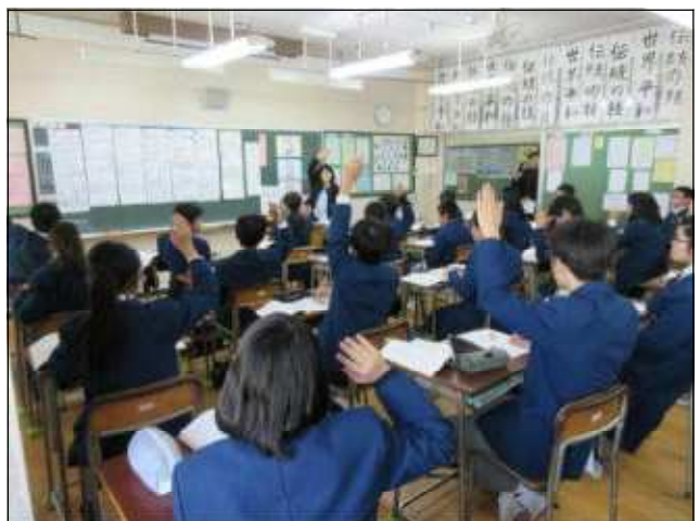
ホワイトボードを黒板に貼って、全体で意見交換し、最後は教師の説話を聞く。信頼できる友達をもつことの大切さ・友情を考える。