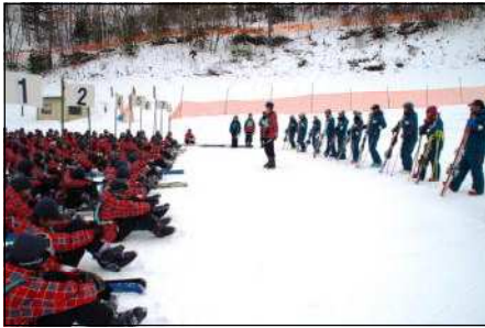
スキー教室開校式の様子