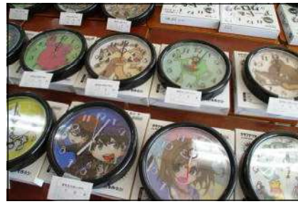
美術科のアートクロック