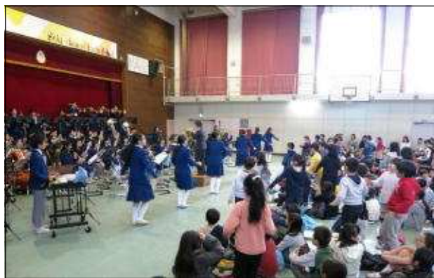
恋ダンスで盛り上がる演奏会

演奏曲：「銀河鉄道999」「スタジオジブリ名曲集」「I seek」 「塔の上のラプンセル・メドレー」 「メイク・ハー・マイン」「前前世」「恋」