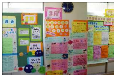
保健委員会の展示