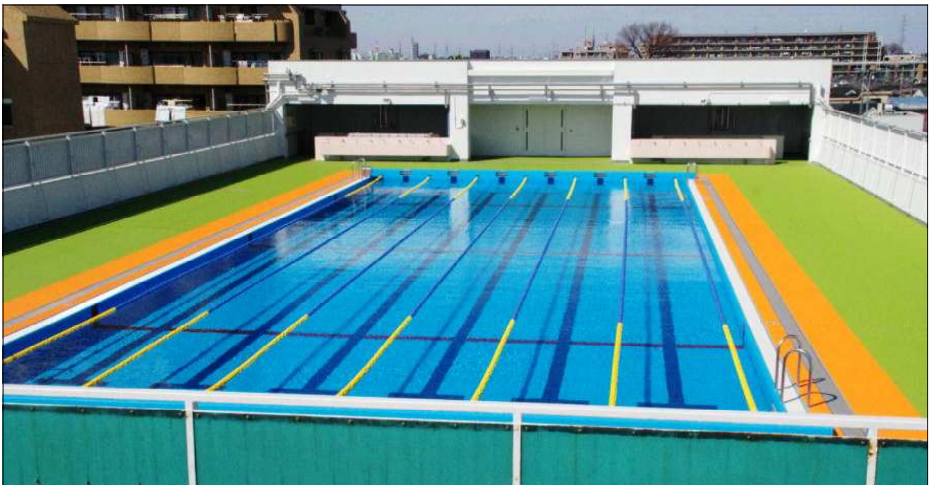
半年間の改修工事が終わり、きれいになったプール。ボロボロであった壁も塗り替えました。