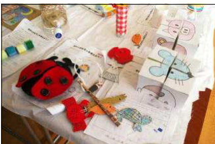
家庭科おもちゃレポート