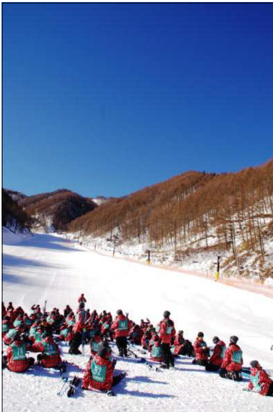
番所が原スキー場