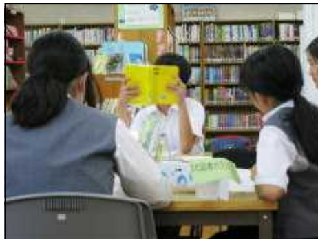
発表後のディスカッションの様子