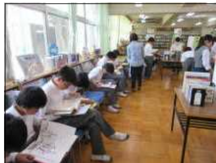
本の探検ラリーの様子です（1学年は5学級。1時間ずつに学級毎に実施しました）

本の探検ラリーを、5月30日（火）1年生5クラスを対象に行われました。 本の探検ラリーとは、学校図書館の中に本をテーマ別に展示し、その中から本を探して読み、クイズに答えるものです。探検ラリーを通して、新しい本と出会い、本に親しむことができます。 関中学校は、練馬区立南大泉図書館より学校図書館支援員の関口さんに来てもらっています。そうした関係もあり、練馬区立南大泉図書館に依頼し実施しました。 配布された問題用紙に6問の問題が書いてあります。 例えば、《自然と科学》問題：『自分の脳を自分で育てる』の「第2章 読むときや聞くとき、脳の中で、なにが起きている？」 脳の中でもっとも程度の高い働きをする場所はどこですか？ 生徒は、まず、《自然と科学》コーナーに行って『自分の脳を自分で育てる』という本を探します。次に、該当するところを読み、問題に答えます。すべて回答したら、担当の先生から正解を受け取り、自分で採点します。終わったら、次のクイズの書いた用紙をもらいます。