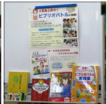
ビブリオバトル関連の本