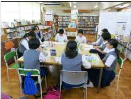
9人によるビブリオバトルの様子