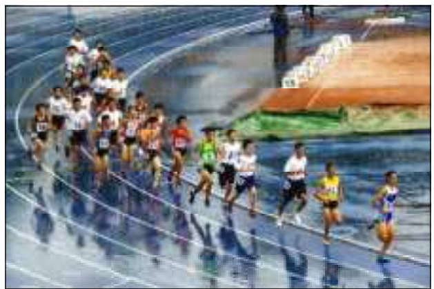
2年男子1500m走（雨の中のレースでした）