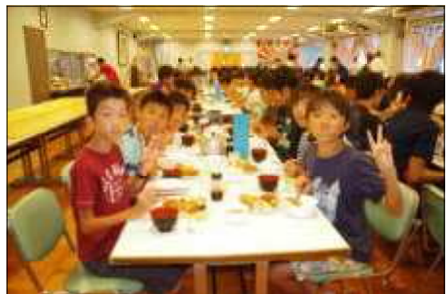
楽しい食事の様子 食事は、一緒に行った開進第四中学校の生徒と一緒に食べました。