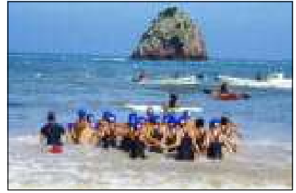
遠くに見えるのは、筆島です。