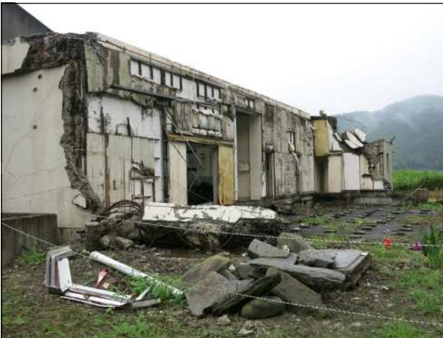
鉄筋コンクリートも破壊する津波の凄さ