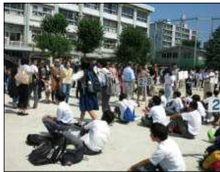
校庭に避難し、その後、保護者に引き渡しをしている様子

練馬区では9月9日(土)午前11時に、震度6弱程度の地震が発生したとの想定で、一斉防災訓練を実施しました。区立学校(小学校、中学校)及び幼稚園で実施されました。