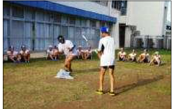
宿舎の中庭で行ったスイカ割り