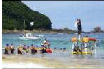
監視員に見守られながら泳ぎます。