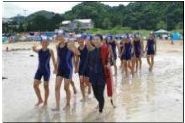
浜辺でパディ確認をして、水泳班ごとに分かれて、いざ海へ！