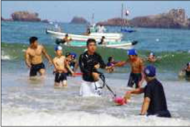
台風5号の影響で、うねりは高かったです。