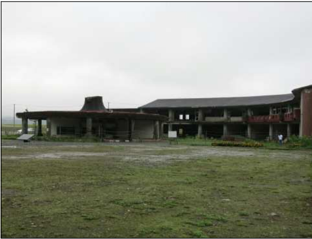
北上川を逆流して溢れた大津波は、校舎二階まで襲った。