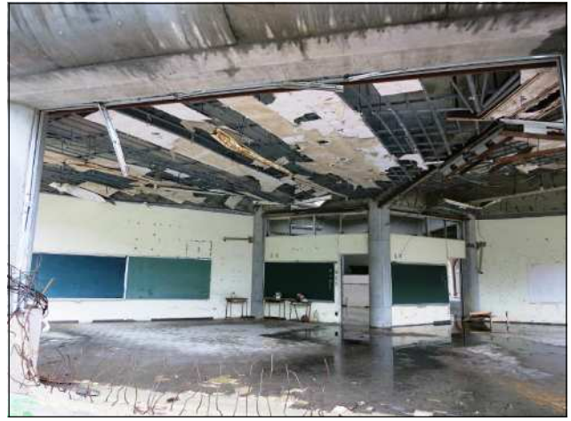
校舎1階の部分（教室の天井も津波の跡が残る）