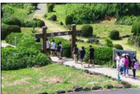
3日目の午前中は、遊泳禁止になったので爪木崎の散策になりました。