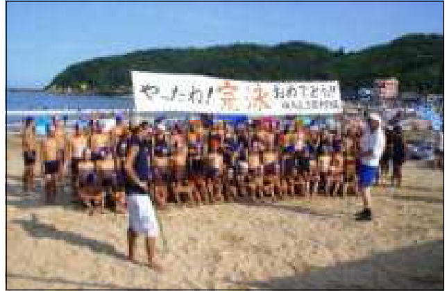
大遠泳、小遠泳を完泳して記念撮影