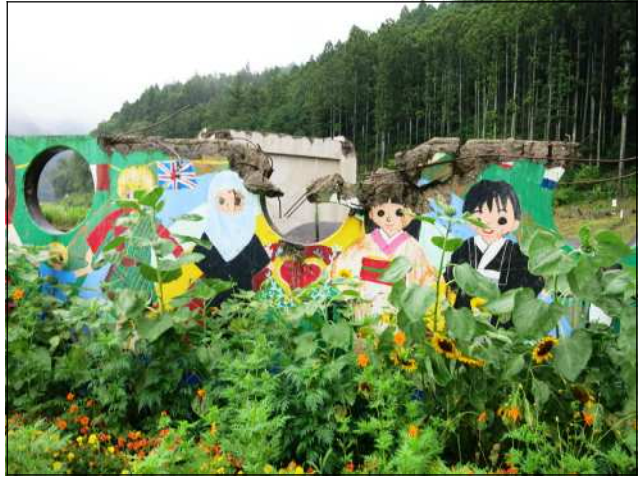
児童たちが描いた作品も津波で無残な姿に

大川小学校は、東北最大の大河である北上川の河口から4 km上流に位置します。東日本大震災（平成23年3月11日午後2時46分 M9）で発生した大津波は、この北上川を逆流し、そして堤防を乗り越えて北上川からあふれ出し、校庭に避難していた児童、教職員を襲いました。亡くなった児童及び教職員は、77人におよびます。行方不明者も10人います。（大川小学校全校児童は、108人）