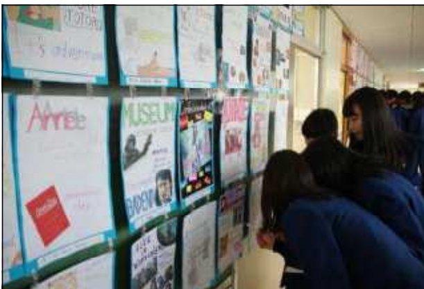
英語科（私のおすすめ本・映画）