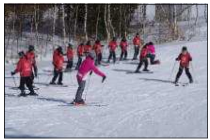
一人ずつ滑り降ります。