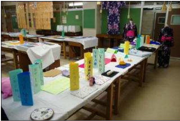
家庭科部（浴衣・刺繍・手芸作品）