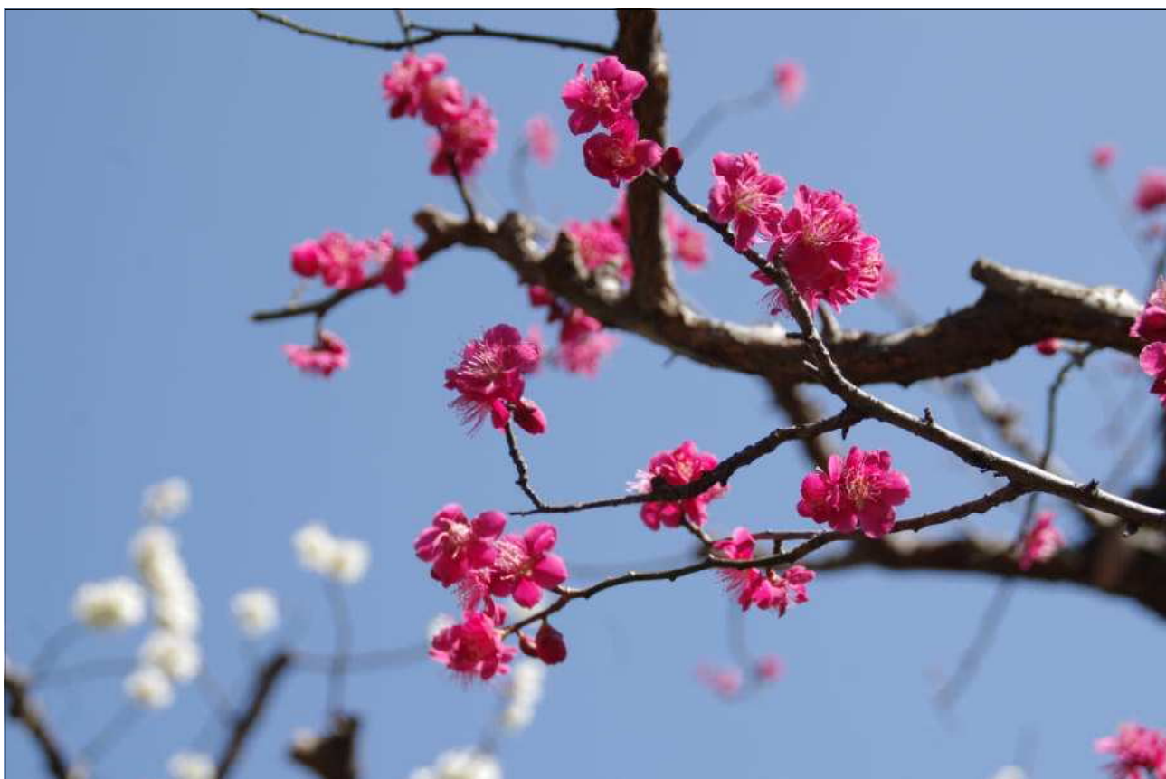
関中学校にある紅白の梅

平成29年度もあと僅かです。3月16日は、第43回卒業証書授与式が挙行されます。修了式は、3月23日です。まさしく、有終の美を飾る時となりました。