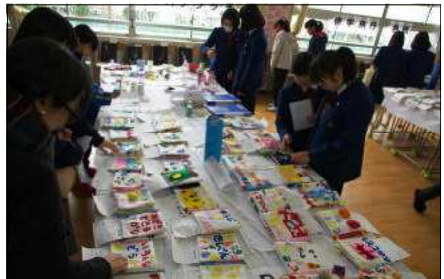
家庭科の生徒作品（布絵本・おもちゃレポート）