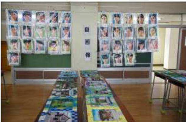
美術科の生徒作品（自画像、木彫額）