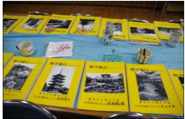
3年修学旅行（スケッチブック・体験学習作品）