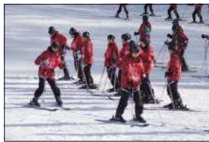
ハの字になってスピードコントロール