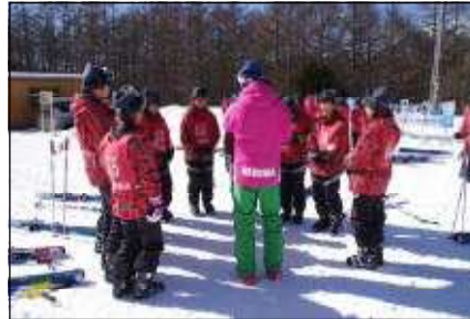
実習班ごとに指導員がついています。