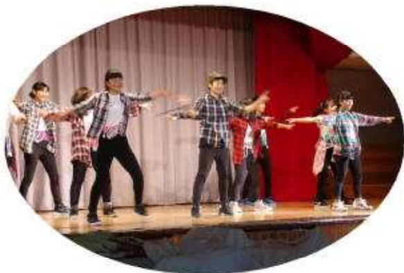
ダンス部のパフォーマンス