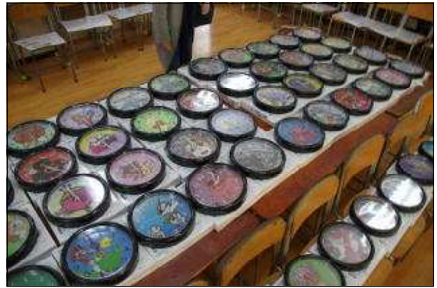
美術科の作品（アートクロック）