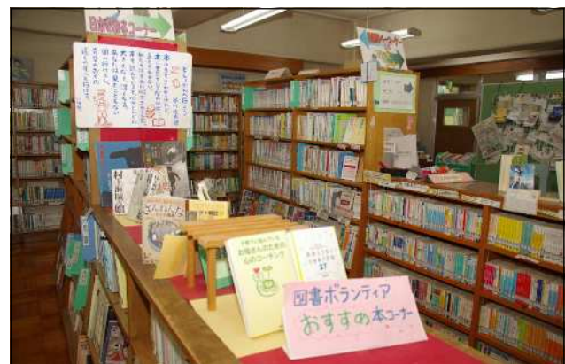
関中学校の学校図書館（新書コーナー、先生のおすすめ本、教科関連コーナー、図書ボランティアおすすめ本等）