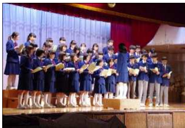
3年有志合唱（友旅立ちの時、遙か）