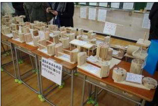
技術科の作品（木材加工）