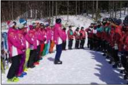
開校式の様子です

宿舎では実行委員会を中心に、一人一人の生徒が自分の係の仕事に責任を持って取り組み、まわりの生徒もその係に協力しようという仲間意識がありました。3日間のレクリエーションもとても楽しく、大いに盛り上がりました。2年生は、このスキー移動教室でさらに絆が深められました。この成功を3年の修学旅行につなげてほしいと思います。