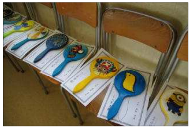
美術科の作品（木彫鏡）