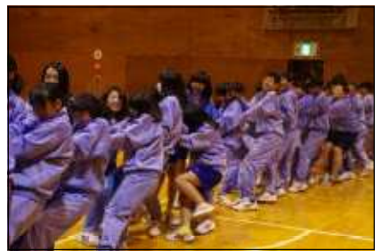
迫力ある学級対抗綱引き（綱は関中から持っていきました）