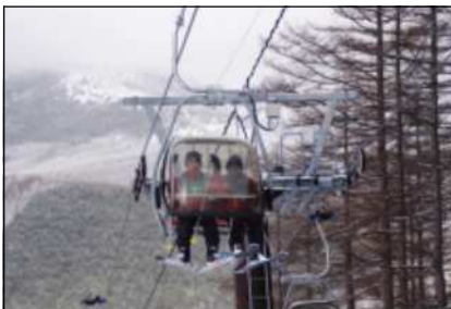
高速2人乗りリフト