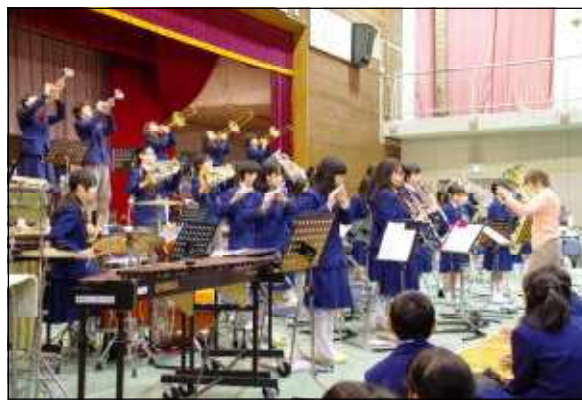
ウインドアンサンブル部の演奏