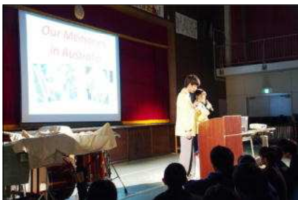
オーストラリア海外派遣報告