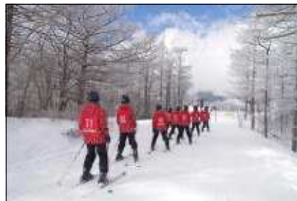
林間コースを滑ります