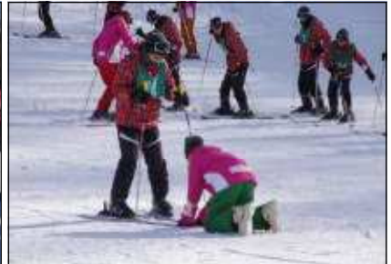
丁寧な指導を受けました。