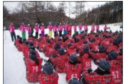
スキー実習閉講式の様子