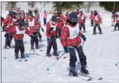
グローブ以外は練馬区が準備