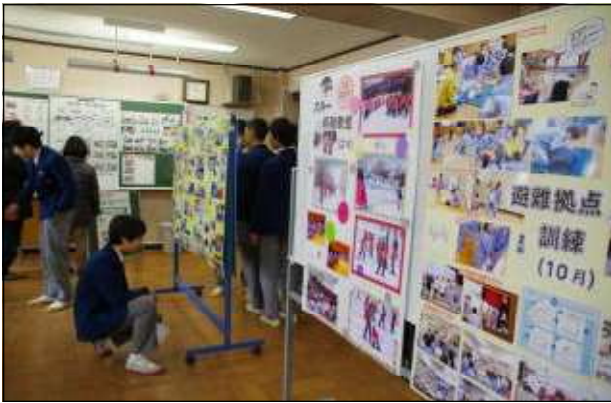
P T A による様々な行事などを紹介する写真パネル