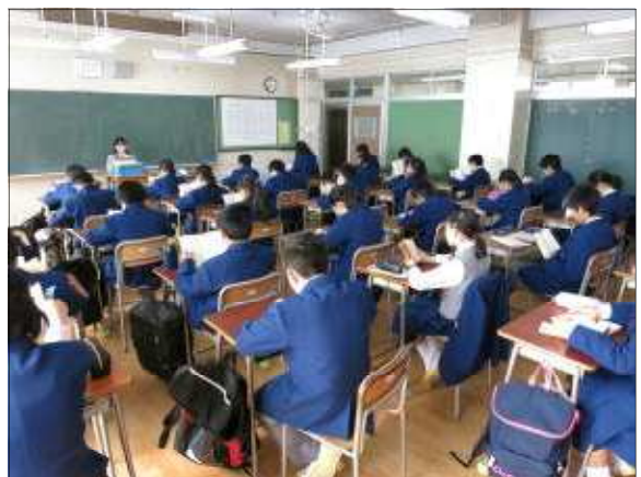
朝読書をする関中生(1年生)