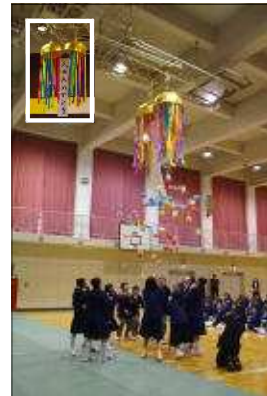
「入学おめでとう」くす玉割り

生徒会主催の新入生歓迎会が4月10日に開催されました。 第1部では、ウインドアンサンブル部の演奏・上級生からの歓迎の言葉と花鉢の贈呈・全校で関中校歌斉唱・新入生からのお礼の言葉がありました。 第2部では、生徒会役員や旧生徒会各種委員長から生徒会活動についての説明があり、最後に恒例の「入学おめでとう！ くす玉割り」が行われました。