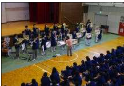
ウインドアンサンブル部の演奏