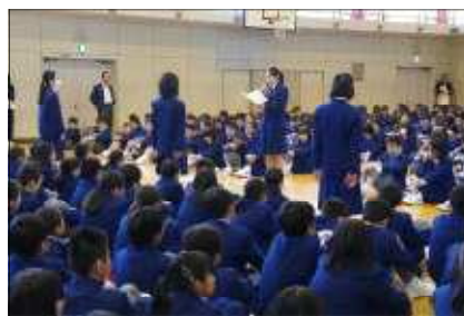
上級生からの言葉と花鉢の贈呈