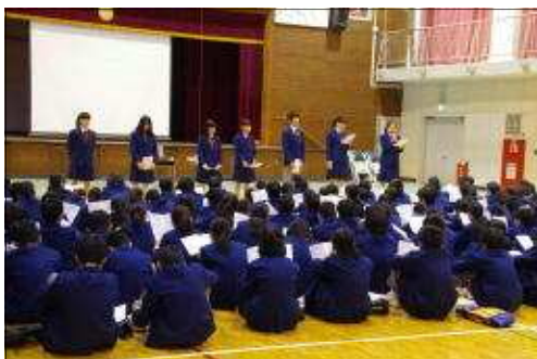
生徒会旧各種委員長からの生徒会の活動について説明を受けました