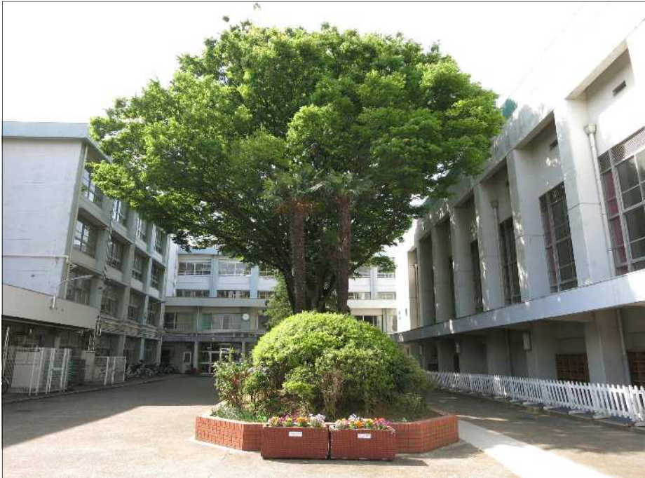
関中学校のシンボルである中庭の榎（けやき）

新入生 160 人を迎え、全校生徒 520 人（15 学級）で、平成 30 年度が始まりました。関中学校は、今年度で、開校 43 年目です。