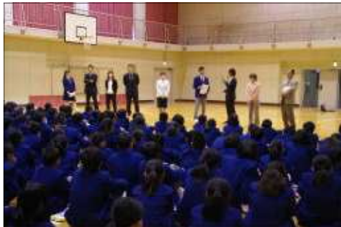
生徒会役員からの新1年生の先生方へのインタビューの様子