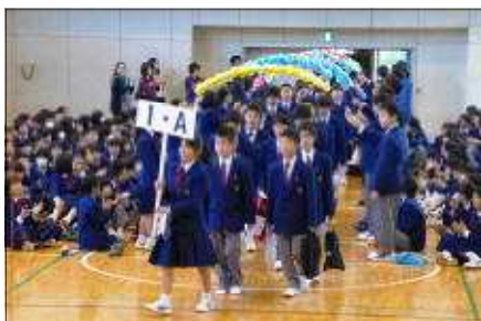
アーチをくぐり新入生の入場