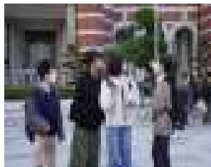
11月27日(水) 2年生「東京学習」