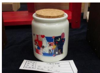
技術・マグカップ